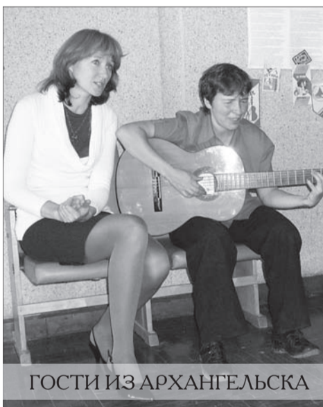
ГОСТИ ИЗ АРХАНГЕЛЬСКА