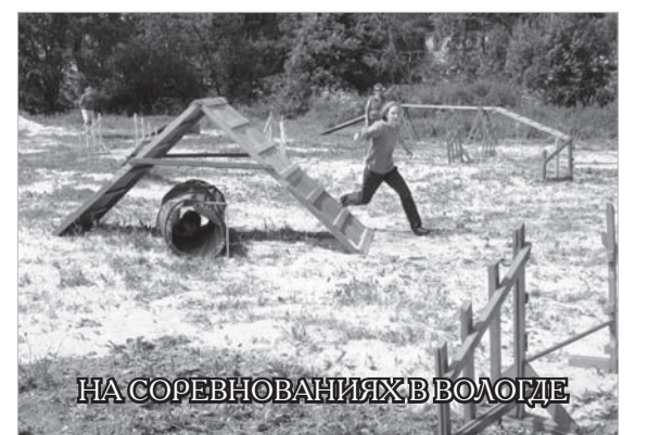
НА СОРЕВНОВАНИЯХ В ВОЛОГДЕ