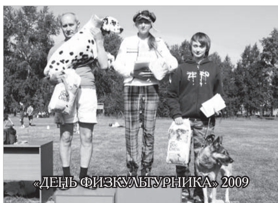
«ДЕНЬ ФИЗИКУЛЬТУРНИКА» 2009