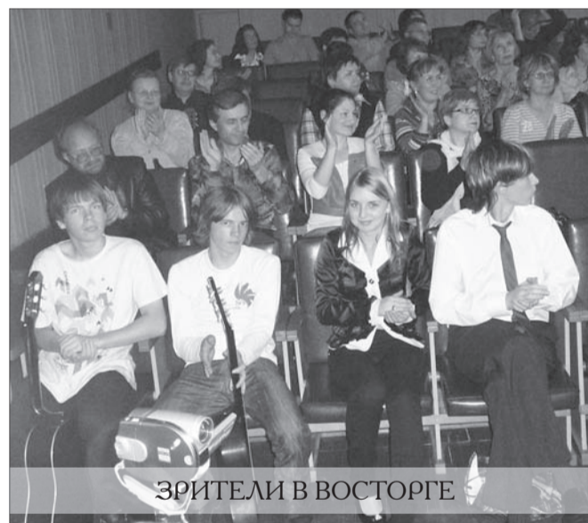
ЗРИТЕЛИ В ВОСТОРГЕ