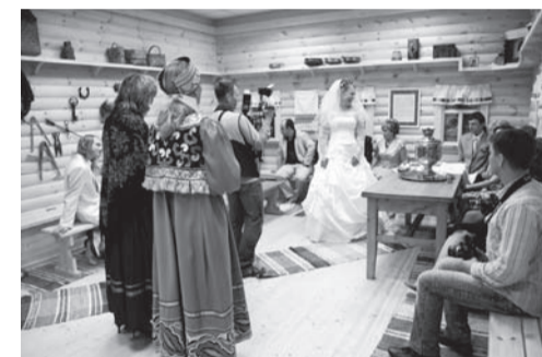
Свадебный обряд в музее.

У молодоженов впервые появилась возможность совершить красивый старинный свадебный обряд и провести незабываемую фотосессию в стилизованном интерьере,