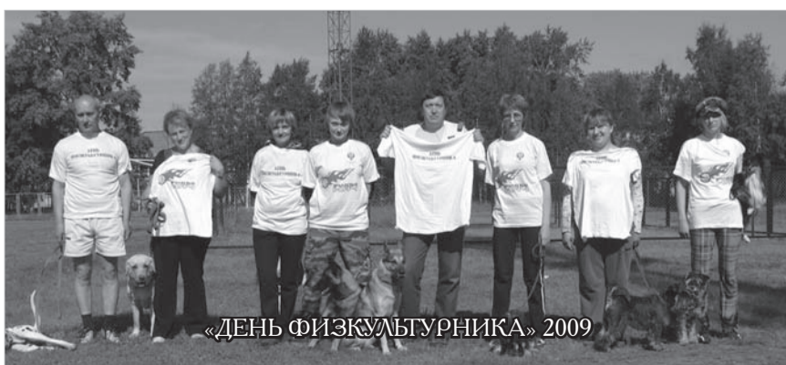
«ДЕНЬ ФИЗИКУЛЬТУРНИКА» 2009